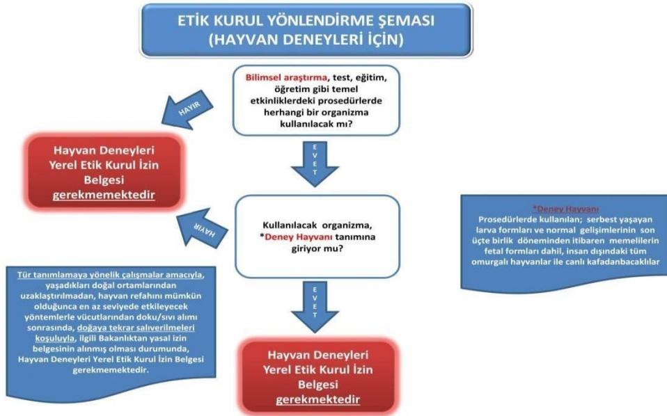
Şekil 1. Etik kurulu onay belgesi için yönlendirme şeması